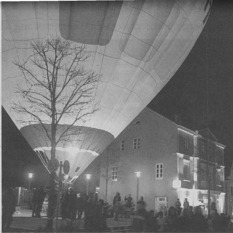
Der Blickfang schlechthin beim Meringer Candlelight-Shopping war der leuchtende Ballon der LEW.