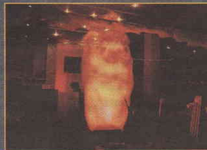
Beeindruckend waren zwei riesige Feuersäulen im Fliesen- und Kachelofengeschäft Haring die sich wie Vulkanausbrüche rot und gelbglühend gen Himmel wälzten.