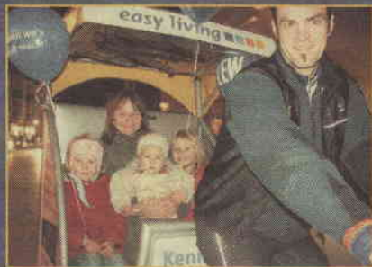
Beleuchtete Rikschas verbreiteten asiatisches Flair in Merings Straßen. Dieser Mama mit ihren Kindern machte es sichtlich Spaß. LEW machte auch dies möglich.